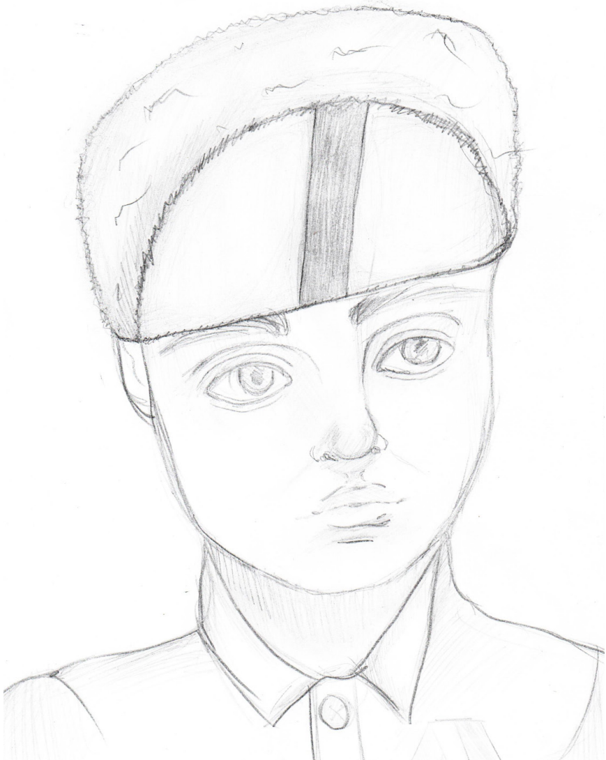
«Юный партизан – Лёня Голиков», Василиса Павлова, 13 лет, п.Пола