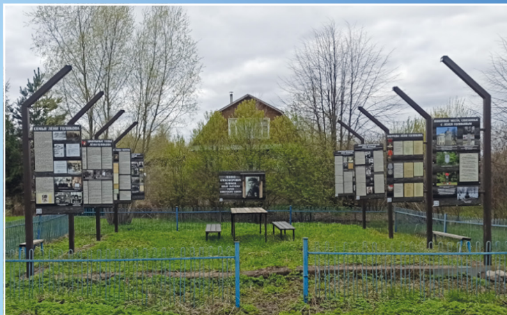
Музей под открытым небом на месте дома матери Лени Голикова в д. Лукино