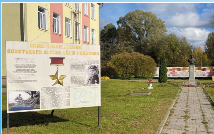
Сквер имени Лени Голикова в п. Парфино